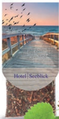
Feel Relaxed 2 Kräutertee